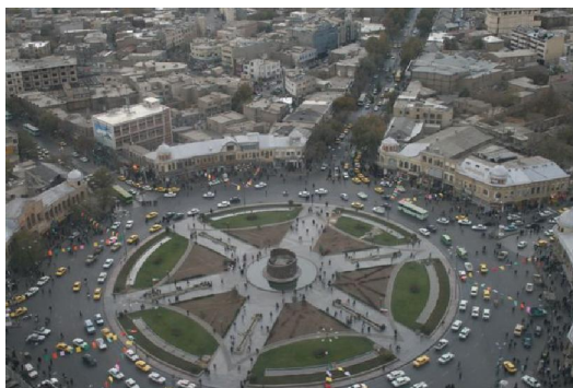
تصویر شماره ۳: المان مرکزی میدان امام خمینی

میدان مرکزی همدان، میدان بزرگی است که امروزه با نام میدان امام خمینی معروف است. طرح و نقشه این میدان توسط مهندس معمار آلمانی کارل فریش، در دوره پهلوی اول تهیه و اجرا گردیده‌است. در سال ۱۳۳۵ فرم میدان شکل گرفت و خیابان‌کشی‌ها به صورت مستقیم پیش رفت (مهندسان مشاور نقش پیروش، ۱۳۸۶).