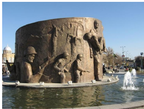
تصویر شماره ۲: محوطه میدان امام خمینی