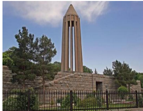
تصویر شماره ۴: میدان آرامگاه بوعلی سینا