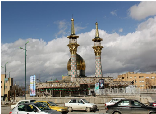
تصویر شماره ۵: میدان امامزاده عبدا...

بنای ابتدایی این آرامگاه در زمان قاجاریه ساخته شد. در سال ۱۳۳۰ انجمن آثار ملی ایران به مناسبت هزارمین سالروز تولد ابوعلی سینا تصمیم به تجدید بنای آن گرفت. طرح و نقشه بنای فعلی توسط مهندس هوشنگ سیحون به سبک معماری قری که بوعلی سینا در آن می‌زیسته از روی قدیمی‌ترین بنای تاریخ دار اسلامی یعنی برج گنبد قابوس در شهر گنبد قابوس اقتباس شده است.