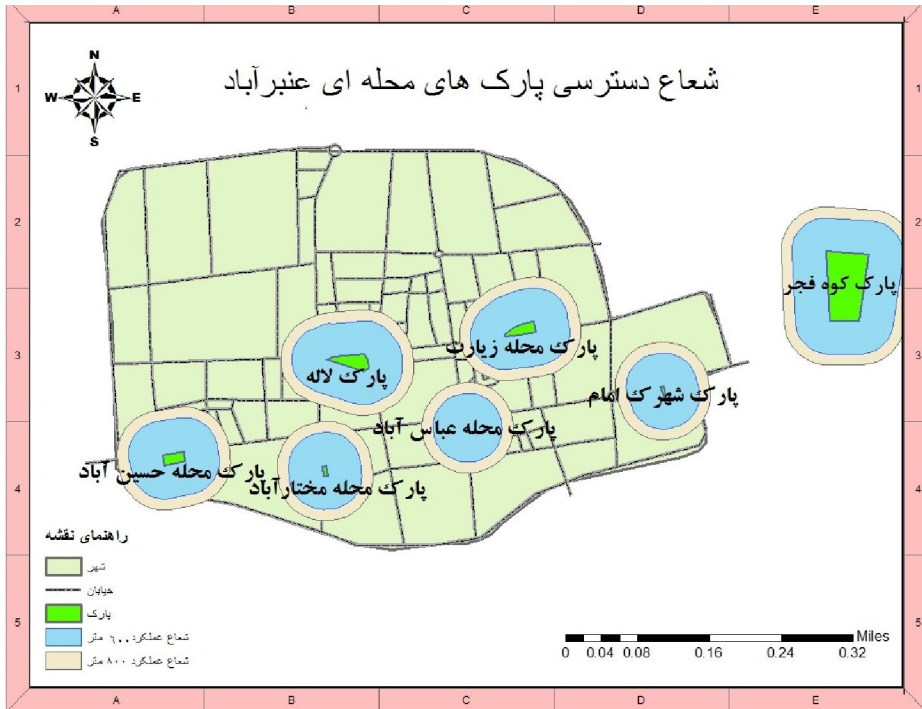
نقشه ۲- توزیع پارک‌ها در سطح شهر عنبرآباد و تعیین شعاع دسترسی آن

بررسی توزیع و ترسیم شعاع دسترسی پارک‌ها نشان داد شهروندان ساکن در بعضی محلات شهر عنبرآباد نمی‌توانند مطابق اصول و استانداردهای تعیین شده به پارک‌ها دسترسی داشته باشند. شهرک نارنج، و محله خدآفرین ۱ و ۲ از جمله این جمله‌اند.